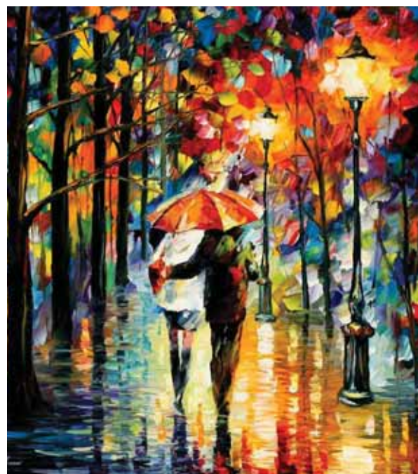
художник Леонид Афремов

Однажды я поняла (тут другие слова лучше подходят — меня осенило), что красота действительно спасет мир. И красота природы, и красота